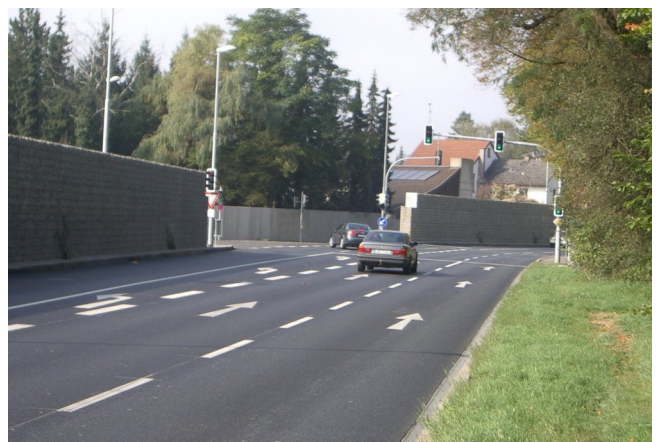
Ringstraße mit leisen Fahrbahnbelägen