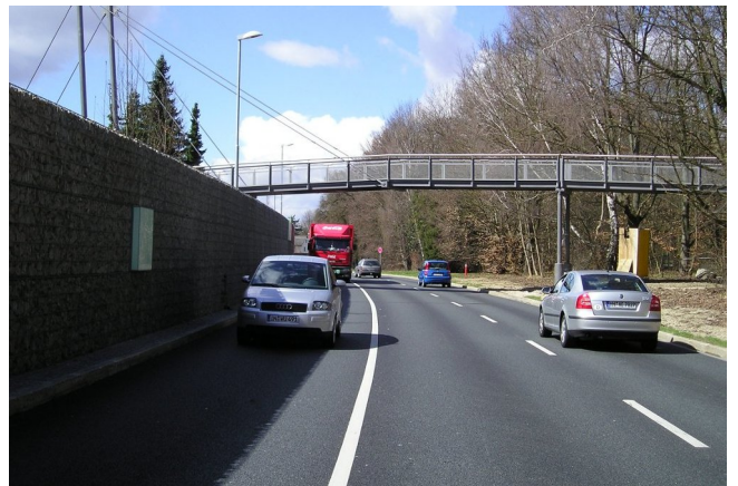
Ringstraße mit leisen Fahrbahnbelägen